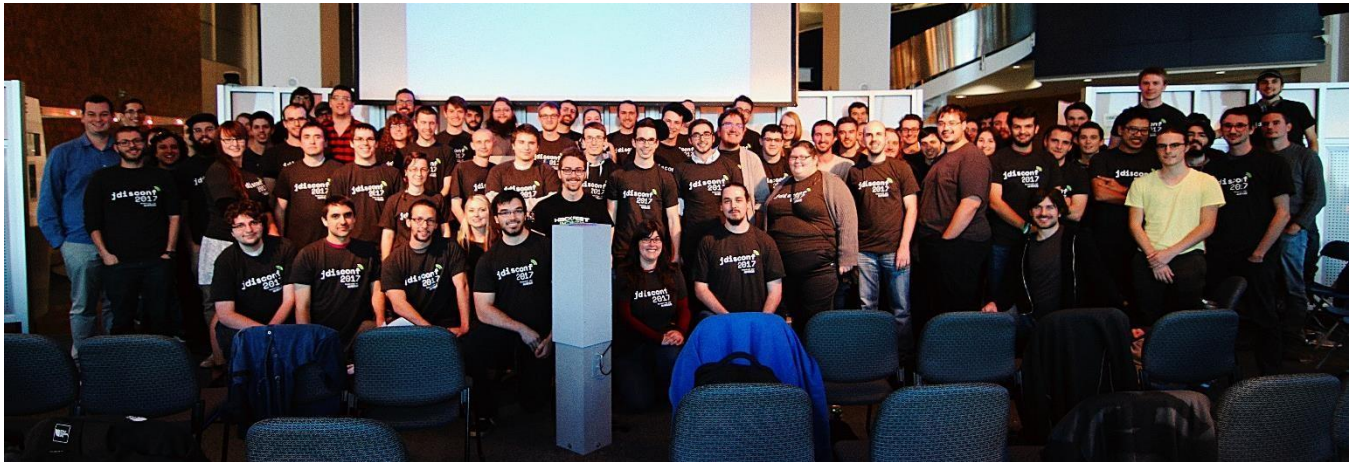
JDISConf 2017. Octobre 2017.

Au nom de toute la communauté JDIS, nous souhaitons vous remercier pour votre engagement et votre soutien. Sans vous, plusieurs de nos activités et de nos délégations ne pourraient pas voir le jour. Soyez assurés que vos contributions nous aideront à faire rayonner l'informatique à l'Université de Sherbrooke et à mieux préparer les étudiant-e-s aux besoins de l'industrie!