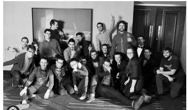
CS Games, mars 2018.