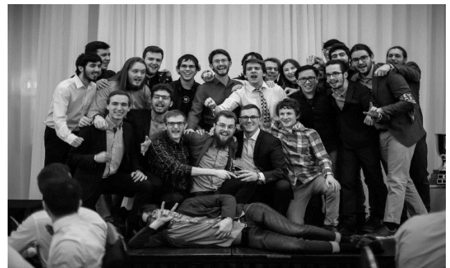
CS Games, Montréal, mars 2019.

Finalement, nous encourageons et diffusons sur les médias sociaux les activités externes qui sont d'intérêt pour nos membres tels que les meetups , les hackathons et autres.