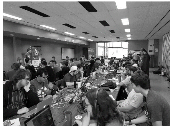
JDISGames, Sherbrooke, mai 2018.

Nous considérons comme membres toutes les étudiantes et tous les étudiants qui participent à au moins une activité de JDIS durant l'année. Suivant cette définition, nous comptons approximativement 300 membres. Ceux-ci étudient majoritairement en science et génie informatique. Dû au fonctionnement de notre groupe, les membres participent aux activités suivant leurs champs d'intérêt. Tous les membres suivent néanmoins les nouvelles et informations de la communauté.