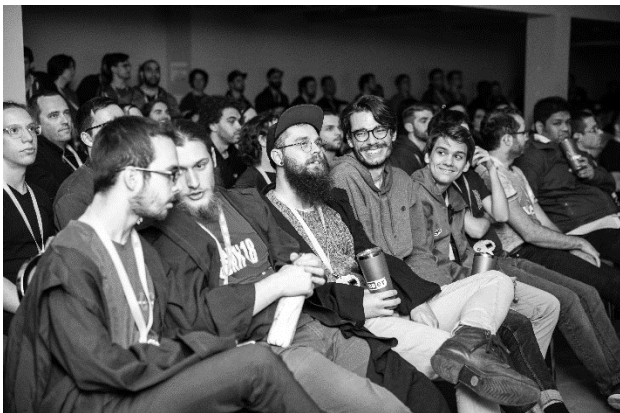
NorthSec, Montréal, mai 2019.

Nous supportons également financièrement et logistiquement la création des délégations de l'Université de Sherbrooke aux différentes compétitions informatiques. Lorsque le nombre d'inscriptions n'est pas limité, nous encourageons tous nos membres, peu importe leur niveau, à se joindre aux délégations. De plus, nous offrons de façon ponctuelle du mentorat afin de préparer nos membres aux compétitions.