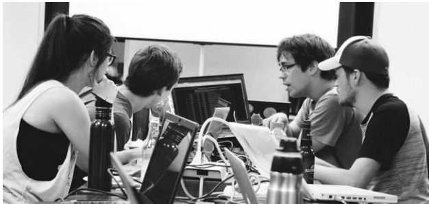
iHack Sherbrooke, juin 2017.